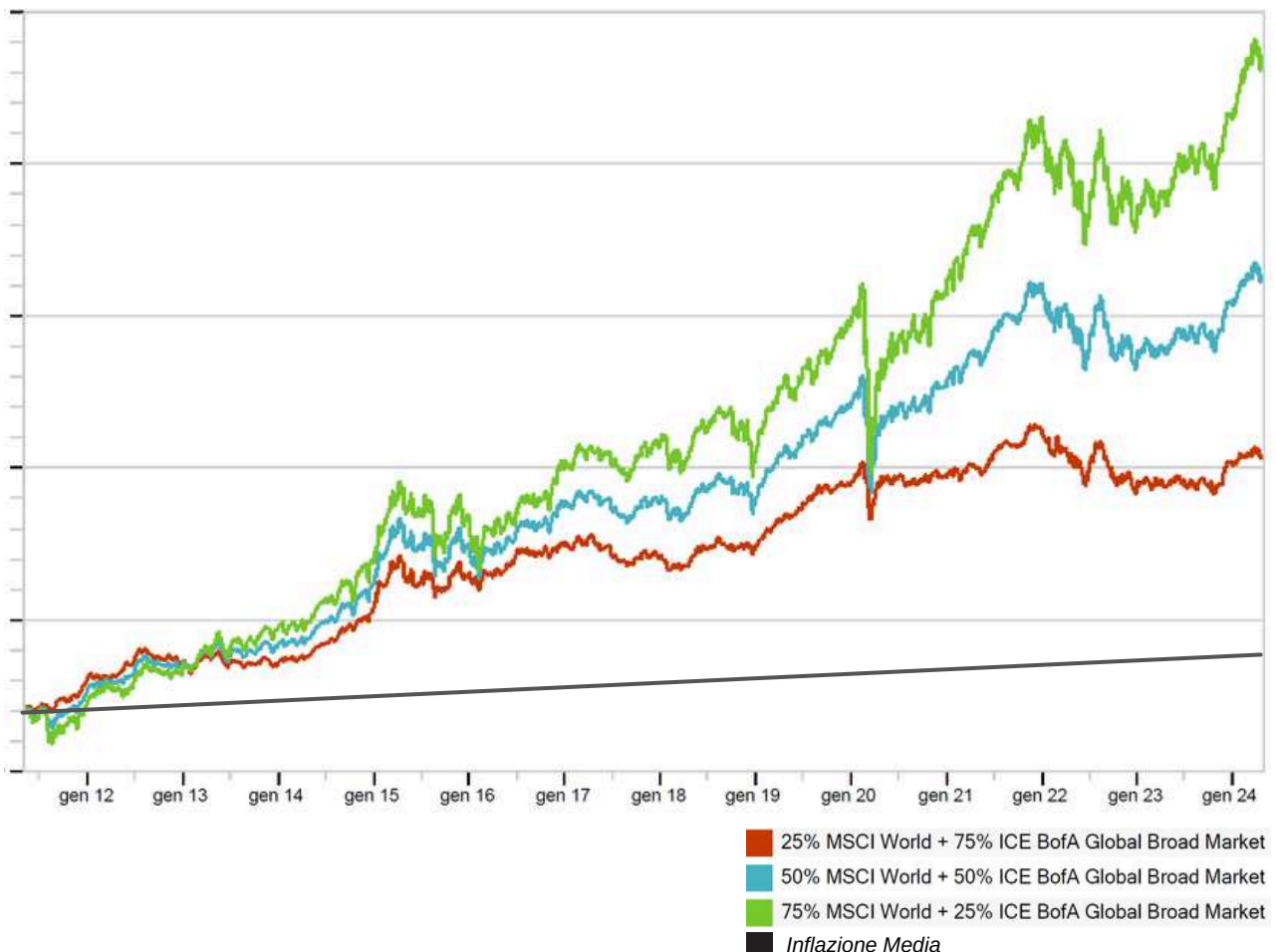
Grafico dei 3 andamenti degli indici di portafoglio con diverse ponderazioni degli strumenti e in ordine di rischiosità

Qui sotto potrai vedere l'andamento di alcuni indici confrontati con l' inflazione media globale. Lasciando i risparmi sul conto potresti perdere importanti opportunità di crescita del capitale, perdendo dunque, negli anni, il potere d'acquisto del tuo denaro.